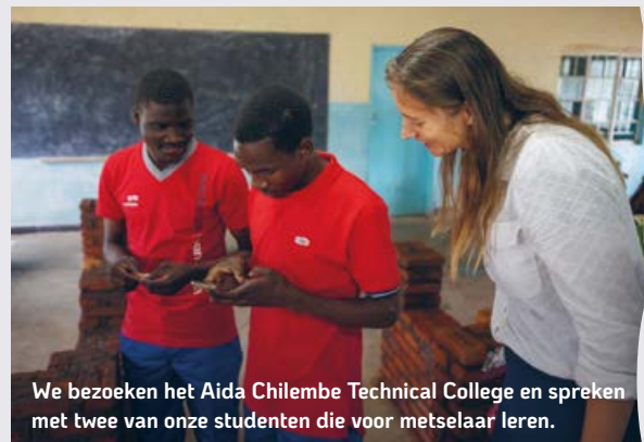
We bezoeken het Aida Chilembe Technical College en spreken met twee van onze studenten die voor metselaar leren.

We leven toe naar het kerstfeest. De herders waren eensgezind in het veld. Ze gingen allen met haast naar Bethlehem en nadat ze Het gezien hadden verkondigden