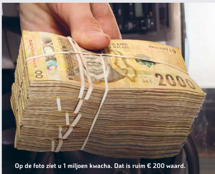
Op de foto ziet u 1 miljoen kwacha. Dat is ruim € 200 waard.

Mocht de inflatie in Malawi verder oplopen en de overheid de wisselkoers niet laten meebewegen, dan voorzien we voor de langere termijn uitdagingen. Voor nu is het echter te vroeg om hier al op te anticiperen. We zijn dankbaar dat we voldoende reserves hebben om de extra kosten voor 2026 te dragen en vertrouwen erop dat de Heere ook volgend jaar zal geven wat nodig is.